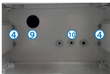
Figure 3 - Vue de dessous - Connectique