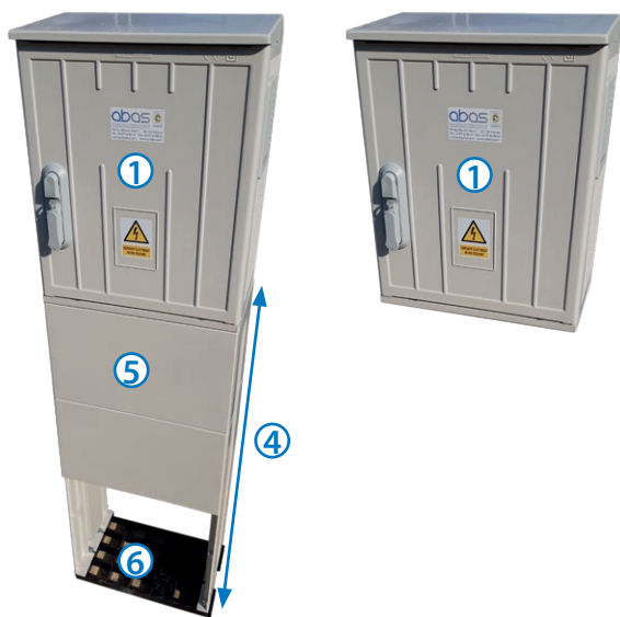
Figure 1 - Armoire sur pied Figure 2 - Armoire murale